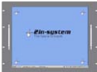
Version rackable 19" 8U (RK)