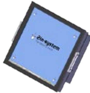
Version Panel Mount (PM)