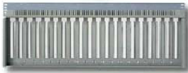
Face arrière pour Bus Passif 20 slots